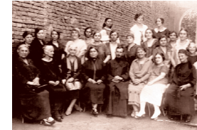
Чланови школског одбора и наставно особље Женске занатске школе