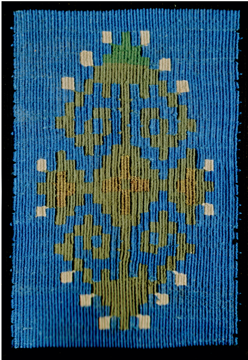
Повез албума фотографија Женске занатске школе