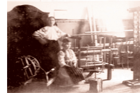
Ученице Женске занатске школе