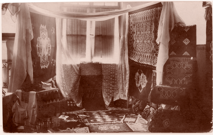
Изложба ручних радова Женске занатске школе