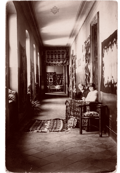
Детаљ са изложбе ручних радова