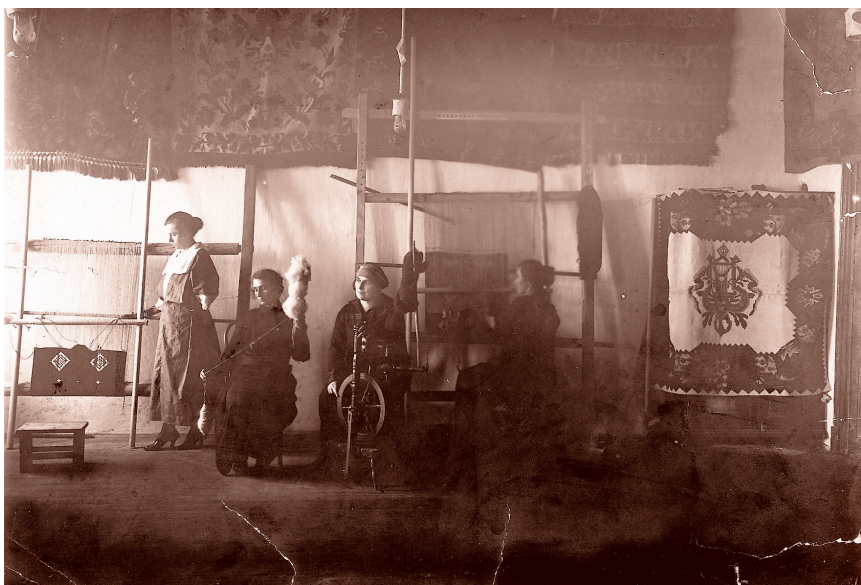
Припрема за ткање у атељеу за ћилиме Женске занатске школе

До 1918. године је радила као помоћна учитељица ручног рада у Државној женској грађанској школи. 1919. је постала хонорарна наставница у гимназији, где је осим ручног рада предавала и немачки језик. Без надокнаде је у мушкој грађанској школи предавала француски језик. Није се удавала. Умрла је 16. децембра 1934. године.